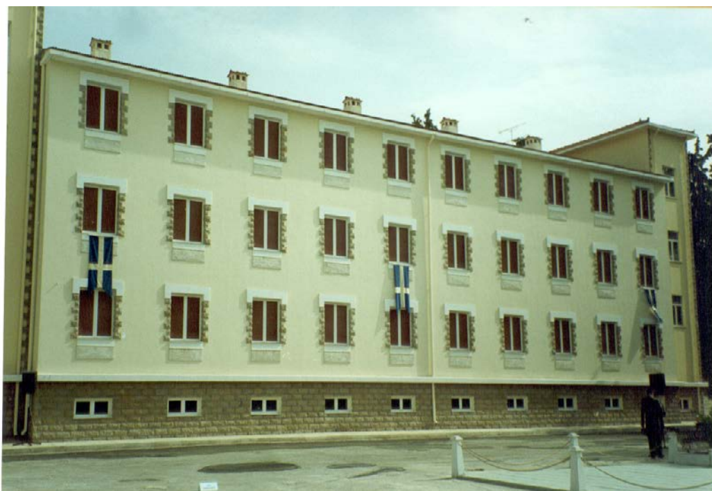
Σύγχρονο κτίριο κοιτώνων εκπαιδευόμενων στελεχών