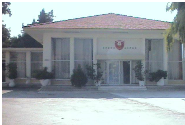
Λέσχη Αξιωματικών Φρουράς Χαλκίδας

Για την εξυπηρέτηση τόσο των εκπαιδευομένων, όσο και του λοιπού προσωπικού της Φρουράς Χαλκίδας, η Σχολή διαθέτει: