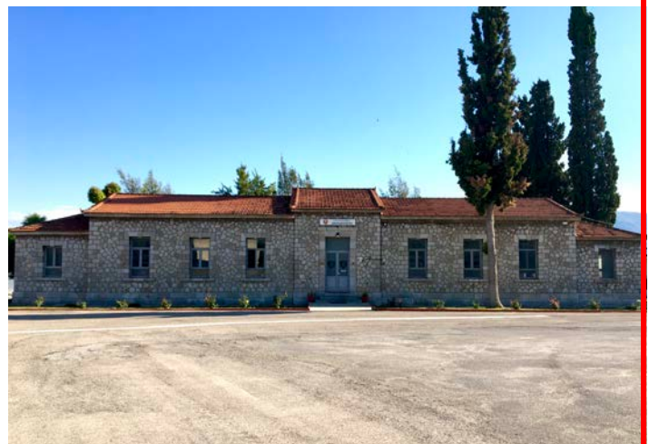
Το Διοικητήριο της Σχολής Πεζικού

Το Στρατόπεδο «Τχη (ΠΖ) Βελισσαρίου Ιωάννη» ευρίσκεται δίπλα στο λιμάνι της πόλεως Χαλκίδας και κοντά στην παλαιά γέφυρα του Πορθμού του Ευρίπου με το γνωστό παλιρροιακό φαινόμενο.