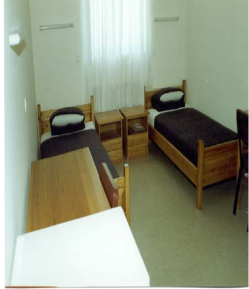
Άποψη εσωτερικού χώρου σε δωμάτιο διαμονής εκπαιδευόμενων στελεχών