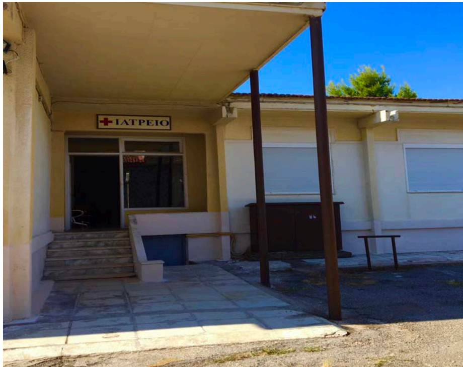
Εγκαταστάσεις Ιατρείου και Οδοντιατρείου